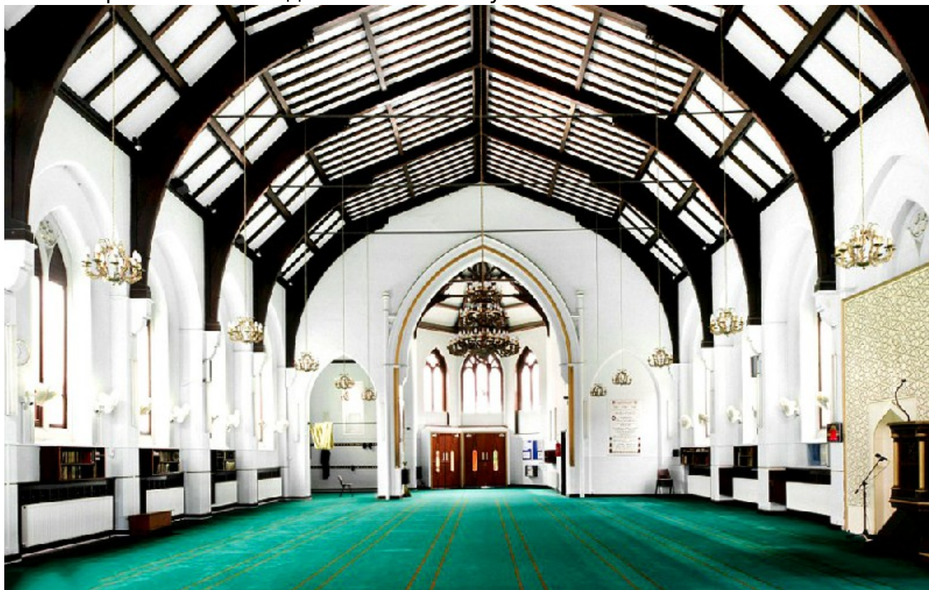
Глазго марказий масжиди

Буюк Британиядаги кўплаб масжидлар олдин черков бўлган. Манчестер шаҳрида жойлашган Дидсбери масжиди ҳам 1883 йили қурилган черков бўлган. 1962 йили черков фаолиятини тўхтатгач, кейинроқ масжидга айлантирилган. Масжид 1000 кишига мўлжалланган.