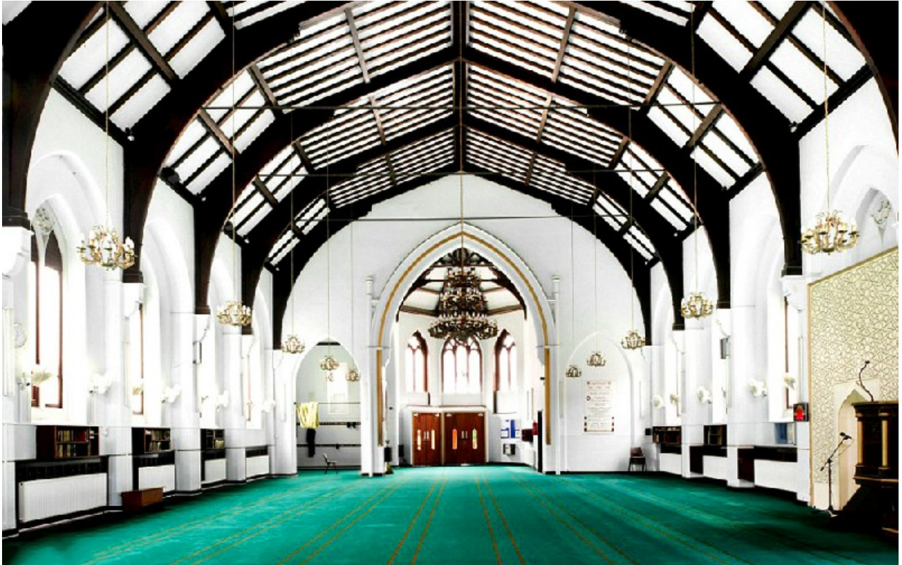
Глазго марказий масжиди

Буюк Британиядаги кўплаб масжидлар олдин черков бўлган. Манчестер шаҳрида жойлашган Дидсбери масжиди ҳам 1883 йили қурилган черков бўлган. 1962 йили черков фаолиятини тўхтатгач, кейинроқ масжидга айлантирилган. Масжид 1000 кишига мўлжалланган.