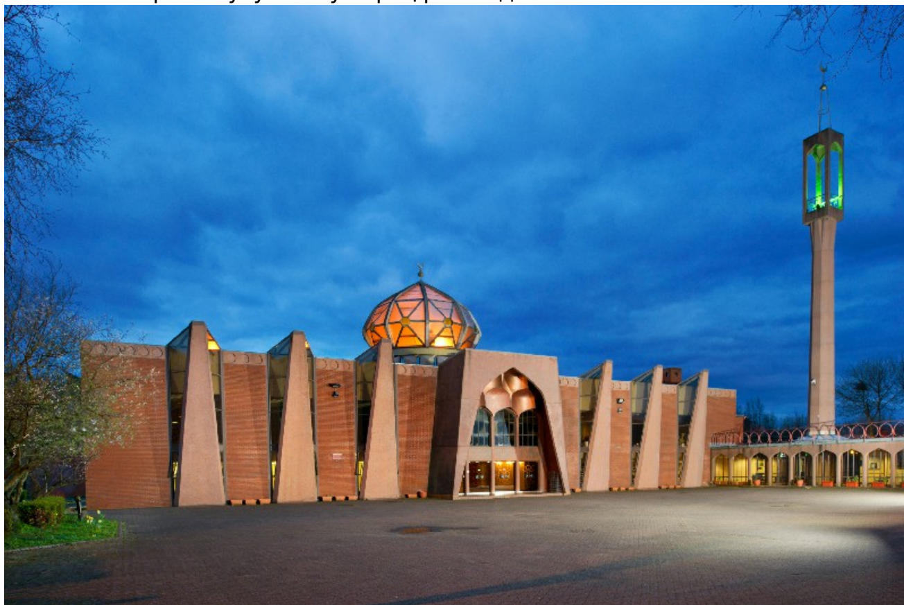
Эдинбург марказий масжиди

Горлабс шаҳрида жойлашган Глазго масжиди 1983 йилда Муҳаммад Туфаил Шаҳин деган тижоратчининг катта ёрдами билан барпо этилган. Масжид расман 1984 йили Бутунжаҳон мусулмонлар лигаси Бош котиби Абдуллоҳ Умар Нассиф томонидан очилган. Масжиднинг ич томонлари анъанавий арабча усулга мувофиқ равишда безатилган.