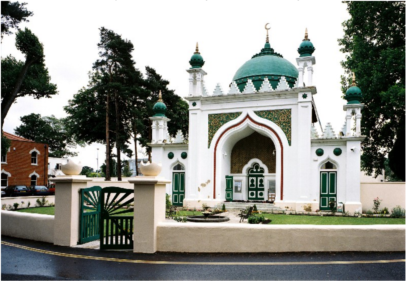
Ҳамкол (Ghamkol) марказий масжиди

Сурра графлигидаги Уокинг шаҳрида жойлашган Шоҳ Жаҳон масжиди мусулмонлар учун қурилган энг биринчи масжидлардан ҳисобланади. Унинг қурлиши 1889 йили ниҳоясига етган. Масжид 600 та кишига мўлжалланган бўлиб, унинг қошида ҳам катталар, ҳам болалар учун диний таълим бериш йўлга қўйилган.