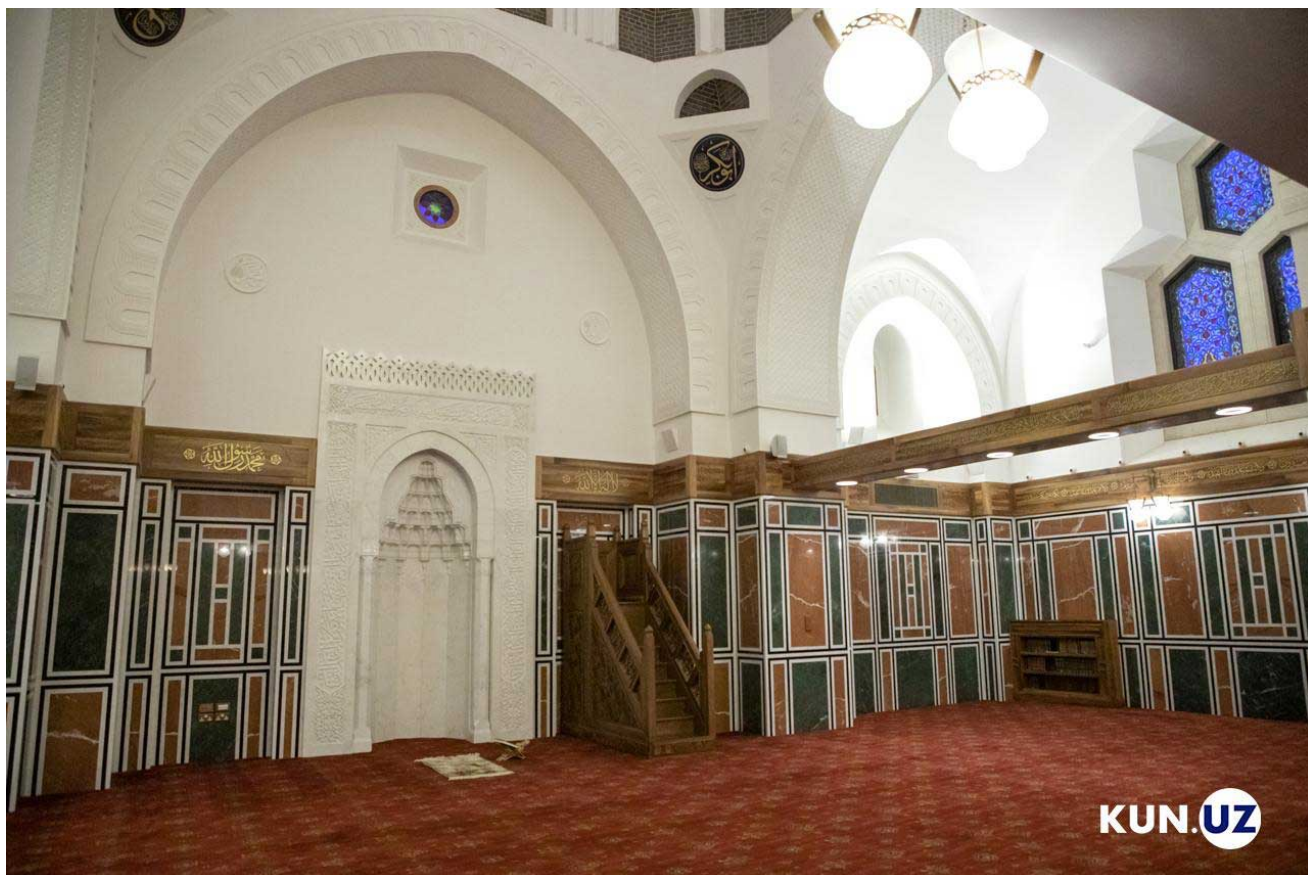
Илмий марказ намозхонаси