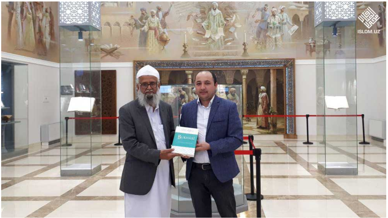
Islom.uz портали таҳририяти