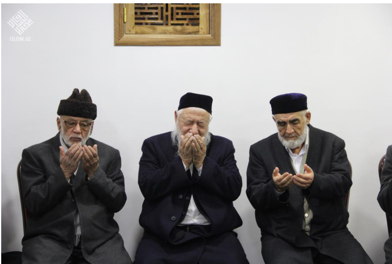
Шунингдек, замонимизнинг машхур муҳаддисларидан Шайх Муҳаммад Аввома, Шайхул ислом, муфтий Муҳаммад Тақий Усманий ҳафизахуллоҳлар