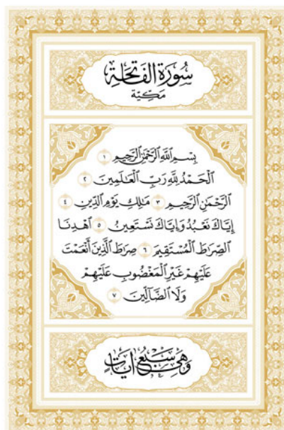
«ҲИЛОЛ-НАШР» МАТБАА-НАШРИЁТИ МУСҲАФИ ШАРИФИ НУСХАСИ