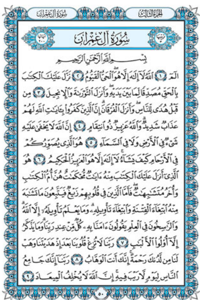
ФАВСОНИЙ НОШИРЛИК УЙИ МУСҲАФИ ШАРИФИ НУСХАСИ