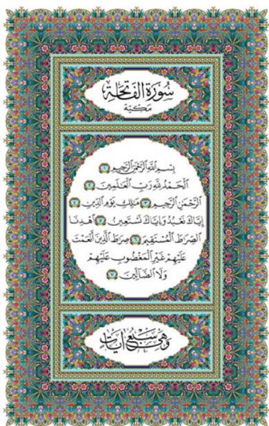
ФАВСОНИЙ НОШИРЛИК УЙИ МУСҲАФИ ШАРИФИ НУСХАСИ