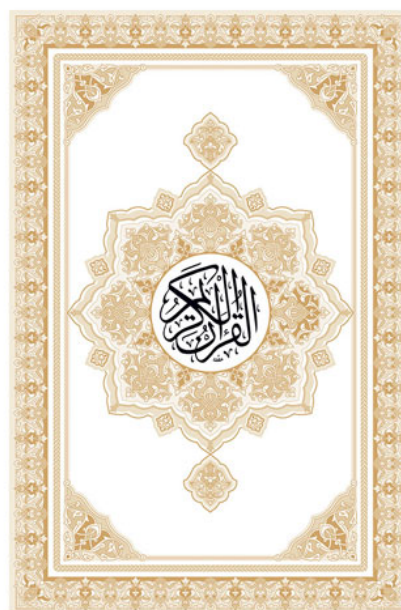
«ҲИЛОЛ-НАШР» МАТБАА-НАШРИЁТИ МУСҲАФИ ШАРИФИ НУСХАСИ