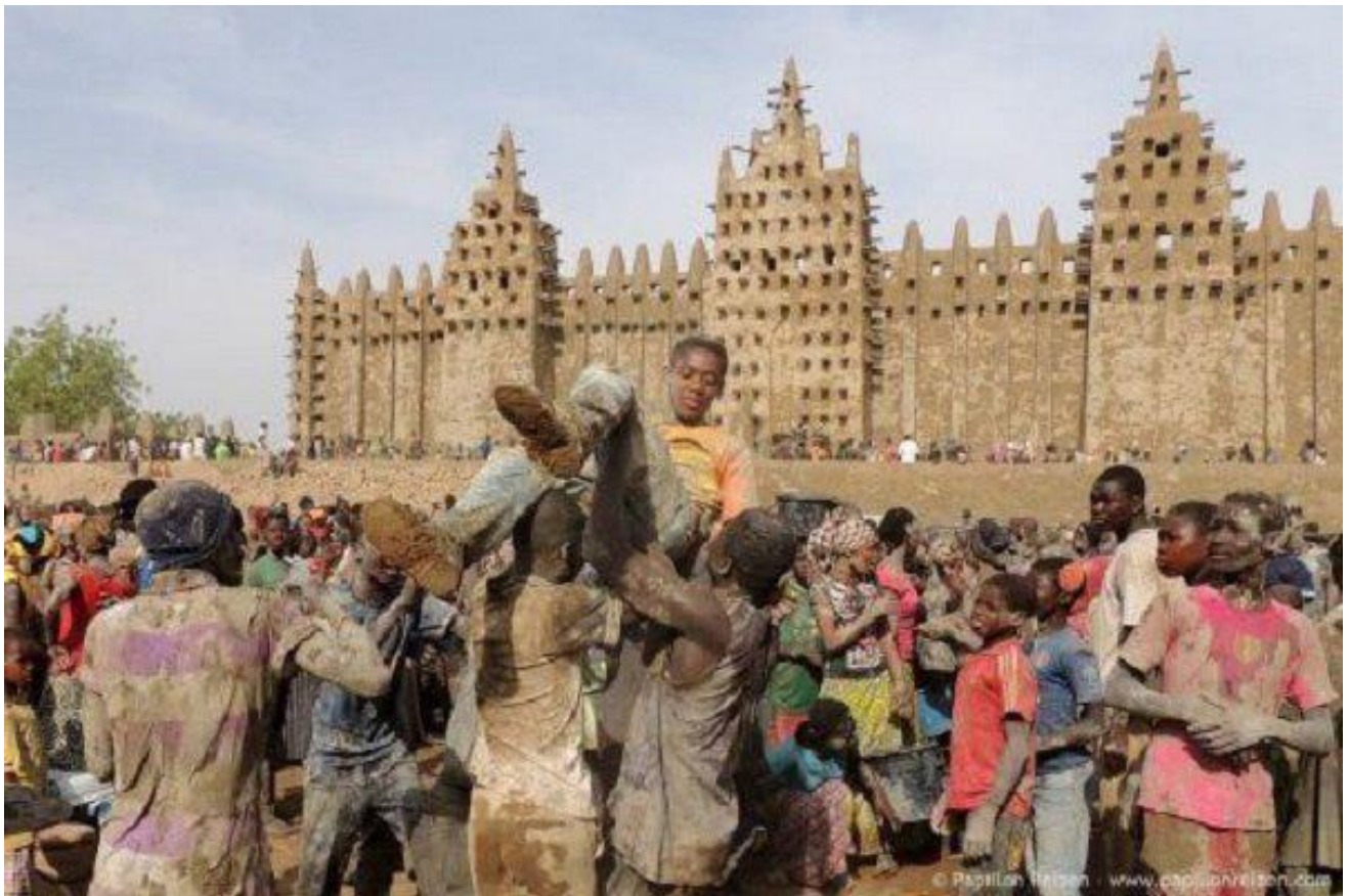
Islom.uz портали таҳририяти