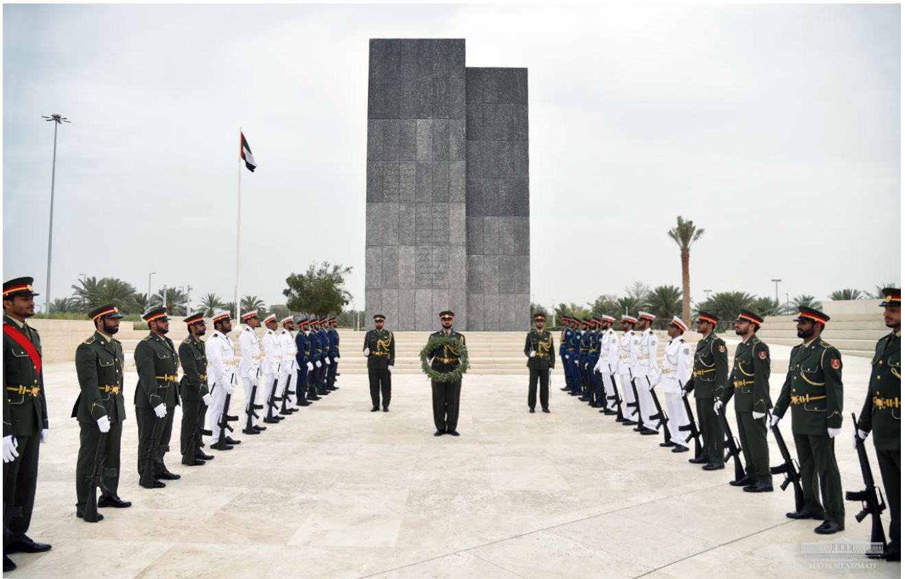
Давлатимиз раҳбари “Ваҳат ал-Карама” ёдгорлигига гулчамбар қўйди.