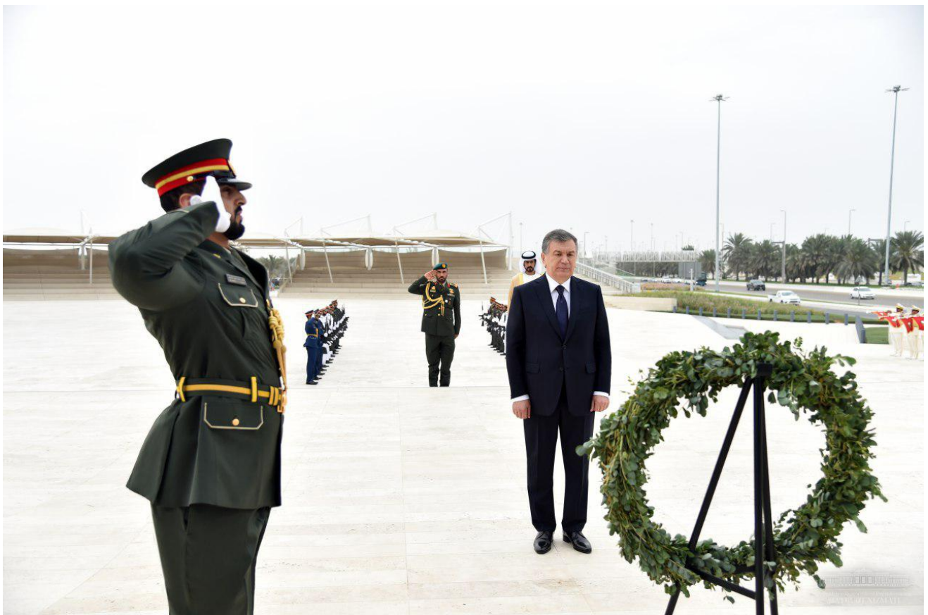
“Қадр-қиммат воҳаси” маъносини англатувчи ушбу мемориал Бирлашган Араб Амирликлари озодлиги ва бирдамлиги учун қурбон бўлганлар